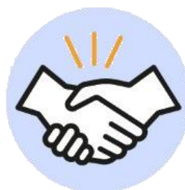
Toque ou aperto de mãos