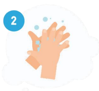
ESFREGUE AS PALMAS