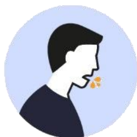
Gotículas de saliva

A transmissão acontece de uma pessoa doente para outra ou por contato próximo (cerca de 2 metros), por meio de: