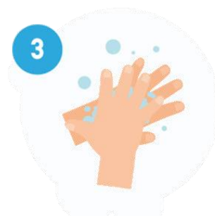
COSTAS DAS MÃOS