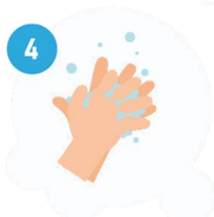
ENTRE OS DEDOS