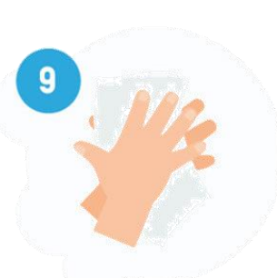
SECAR BEM COM PAPEL TOALHA