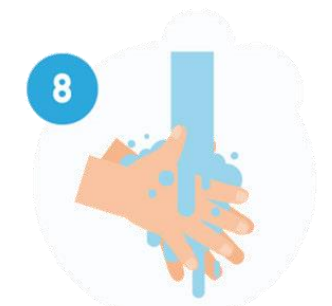
ENXÁGUE AS MÃOS