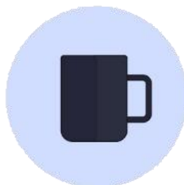
Objetos ou superfícies contaminadas